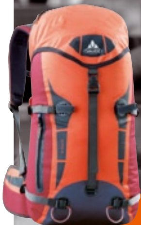
Tec Rock 32